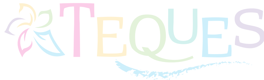
TRANSPARENCIA COLOR AL 20%