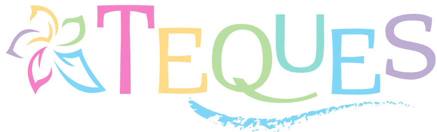
TRANSPARENCIA COLOR AL 50%